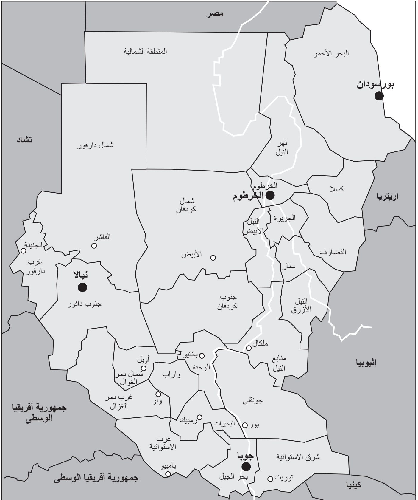
الشكل 1: خريطة السودان